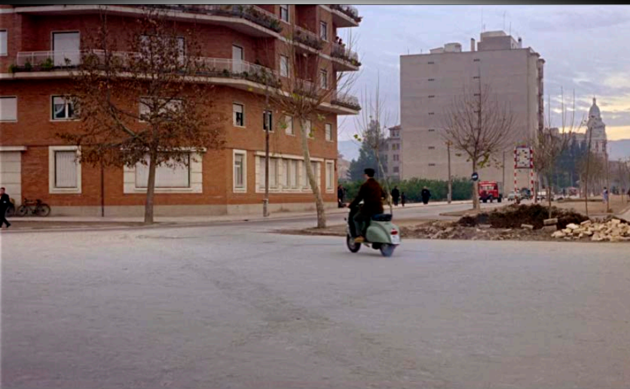
Fotograma de Siempre en mi recuerdo (Silvio F. Balbuena / Manuel Caño, 1962)