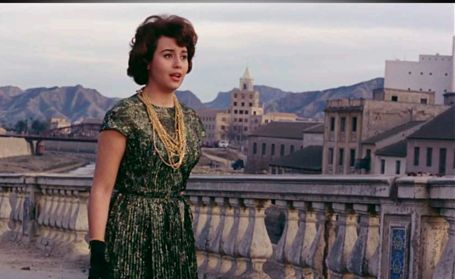
Fotograma de Siempre en mi recuerdo (Silvio F. Balbuena / Manuel Caño, 1962)