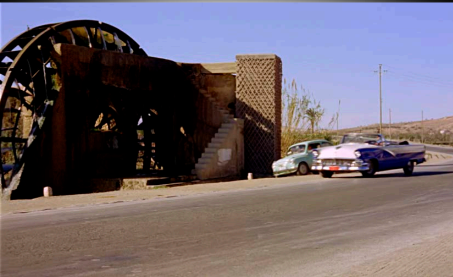
Fotograma de Siempre en mi recuerdo (Silvio F. Balbuena / Manuel Caño, 1962)