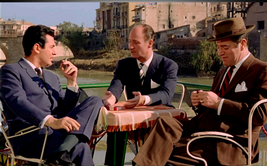
Fotograma de Siempre en mi recuerdo (Silvio F. Balbuena / Manuel Caño, 1962)